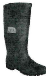
Bota Negra HI-SEG Gs. 44,000

Seleccionar opciones ( https://www.regimiento8.com.py/producto/bota-motosafe/ )