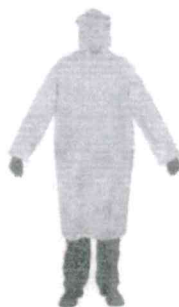
Piloto Amarillo Impermeable Gs. 65,000

Seleccionar opciones ( https://www.regimiento8.com.py/producto/bota-de-lluvia-negra/ )