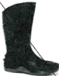
Bota Motosafe Gs. 121,000

( https://www.regimiento8.com.py/producto/bota-motosafe/ )