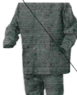
Conjunto para lluvia Azul Gs. 88,000