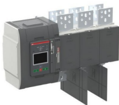
ABB REF: 1SCA150939R1001