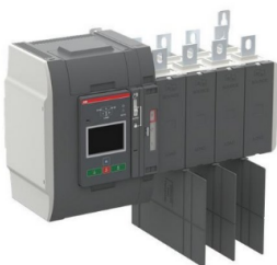
ABB REF: 1SCA151057R1001