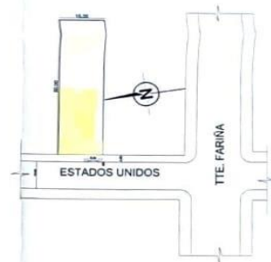
PLANTA DE UBICACIÓN ESCALA 1:500