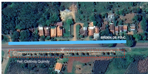
PLANO DEL SECTOR DE INTERVENCION