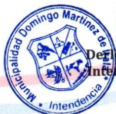
Derlis Javier Benegas Intendente Municipal