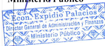
Econ. Expidio Palacios Ministerio Público